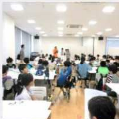
5月11日(土) 第2回子ども実行委員会 公共施設などの中身が決定した。懸案だったハローワークも必要性が認められた。