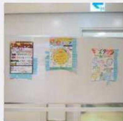
6月29日(土) 第4回子ども実行委員会 成田市場見学後、店長の心得を学び、ポスターの選出が行われた。