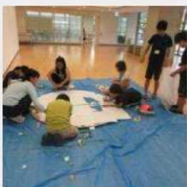
夏休み期間 正面入り口に飾られるバナーの作成などが急ピッチで行われた。