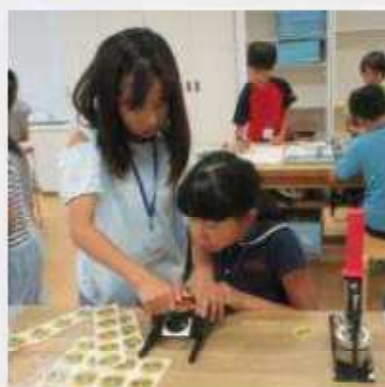
夏休み期間 夏休みのシフト表を作成、各ブースごとに関わられ、まちに必要なものなどの制作を行った。