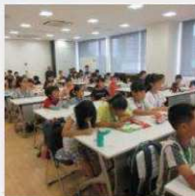
7月13日(土) 第5回子ども実行委員会 各担当ごとに今後の準備の仕方や必要な用具・材料の詳細を決めた。