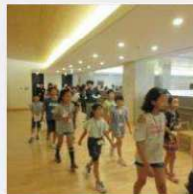
7月20日(土) 第6回子ども実行委員会 夏休みの活動について確認を行い、館内を見学し、各ブースの場所を確認した。