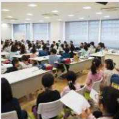
4月27日(土) 第1回子ども実行委員会 参加者の自己紹介、リーダーの選出、何をやりたいか、コンセプトを話し合った。