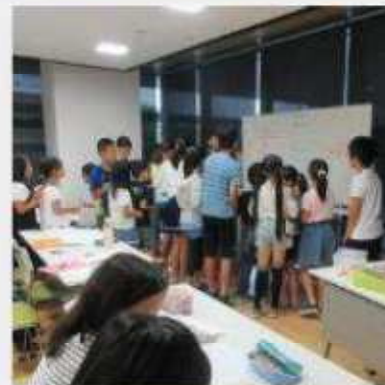
6月8日(土) 第3回子ども実行委員会 ブースごとの役割分担を決め、今年は16業種に決定した。