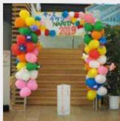
8月3日(土) 前日準備 今まで作成してきたものを実際のブースに配置、飾り付けを行った。