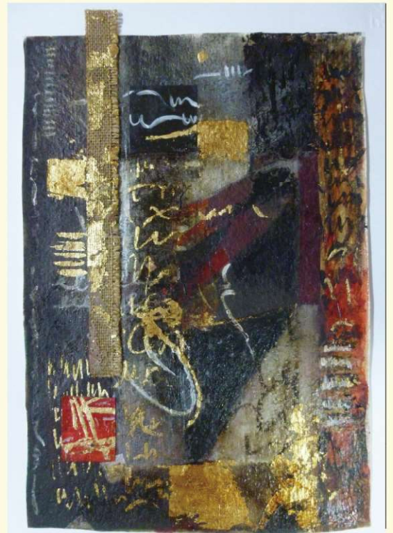
Paola Failla - Leggenda del Quadrato Rosso (The legend of the red square), 2023 Tecnica mista su carta (Mixed technique on handmade paper), 38×25cm