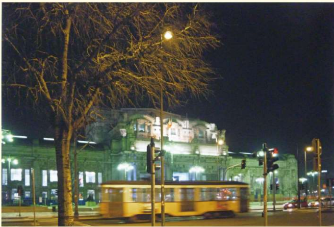
Marina Luzzoli - Stazione Centrale, Milano 2011 - Giclée print on Hahnemuehle paper - 44×64cm