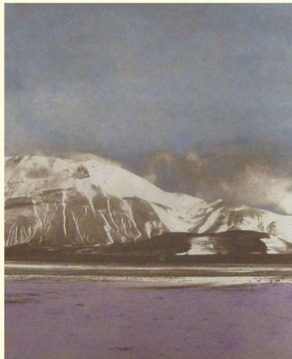
Maria Letizia Gabriele - Castelluccio #2, 2023 Stampa fotografica su carta salata, pastello (Salt paper print, pastel), 56×38.5mm