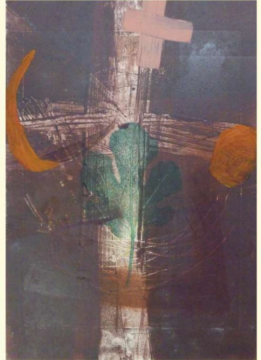
Davanti a una foglia di fico (In front of a fig leave), 2023 Incisione, monotipo, intervento a mano (Etching, monotype, manual intervention), 50×35cm