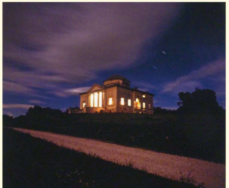
Richard Khoury - Rocca Pisana #4, Lonigo 1996/2024 - Giclée print on Hahnemuehle paper - 40×40cm