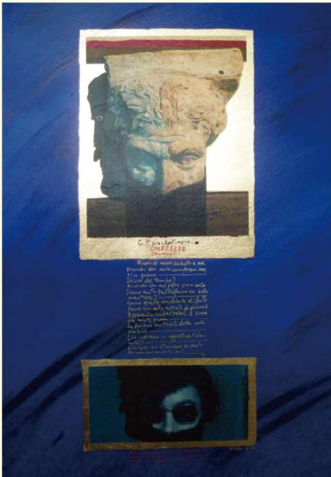
Valerio Vivian - L'Ombra del poeta (The Shadow of the Poet), 2024 Tecnica mista su carta, acrilico (Mixed technique on paper, acrylic), 70×50cm