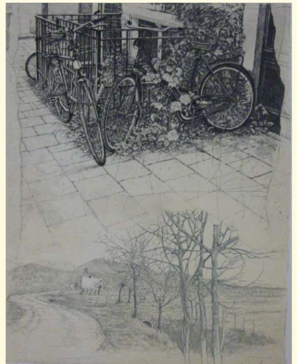
Livio Ceschin - Per ritrovare il tempo (To find the time again), 2020 Acquaforte, puntasecca (Etching, dry point) 50×35cm