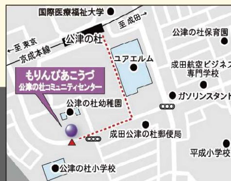
京成本線「公津の杜」駅より徒歩5分