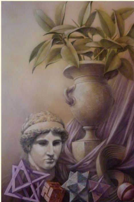
Emilio Baracco - Prismi composti (Compound prisms), 2024 Pastello, acquerello (Pastel, watercolor) 70×50cm